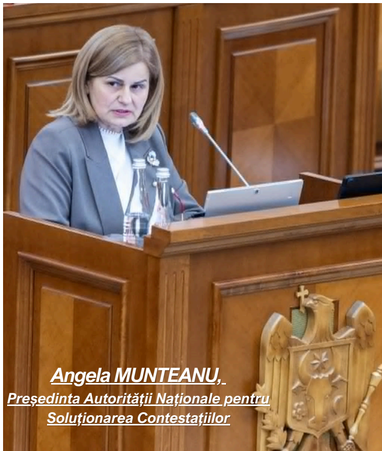
Angela MUNTEANU, Președinta Autorității Naționale pentru Soluționarea Contestațiilor

Luna mai 2026 a fost marcată de acțiuni orientate spre consolidarea parteneriatelor instituționale, alinierea la standardele europene și dezvoltarea profesională continuă a echipei