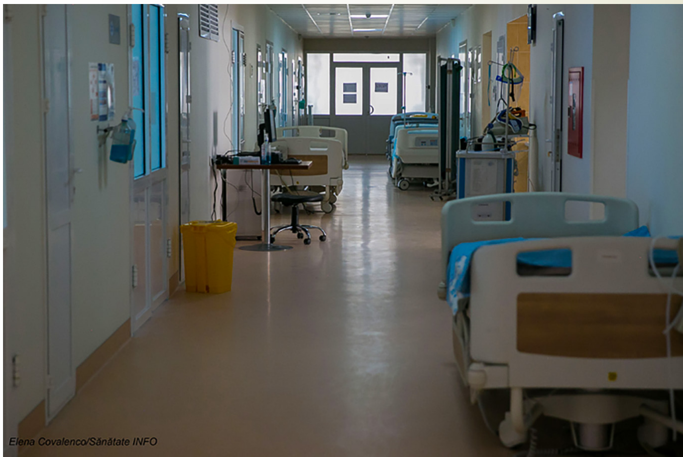
Elena Covalenco/Sănătate INFO